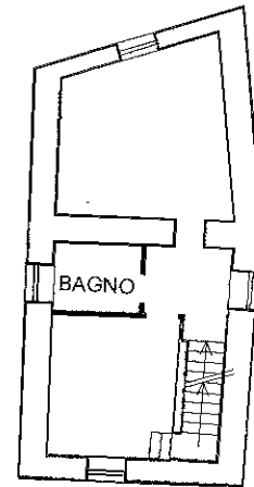
PRIMO PIANO H=3.15